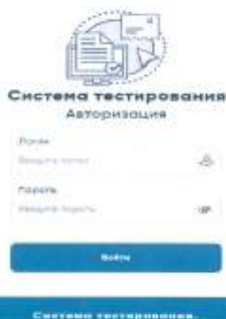
Рисунок 1. Авторизация участников