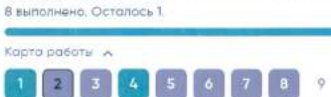
Рисунок 4. Карта работы

Если участник пропустил какой-то вопрос и хочет к нему вернуться, можно нажать кнопку «Назад» или выбрать номер пропущенного вопроса в карте работы (Рисунки 3, 4).